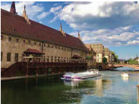
中央運河值得坐船遊覽哦。