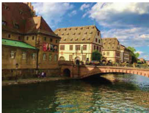
中央運河是整個城市最大的一條貨物運輸的場所，運河的河道非常的寬闊。