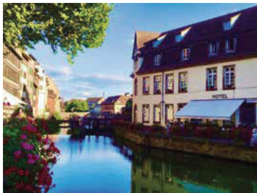
照片看起來像明信片。