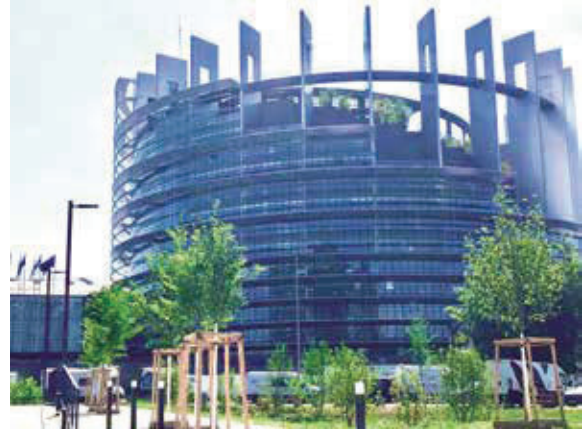
花百億蓋12年歐盟新總部2016年完工。