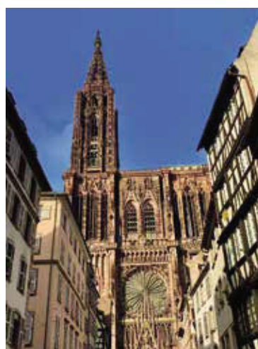
教堂高達123米的塔尖是安特衛普最優美的地標，被譽為中世紀的摩天大樓。