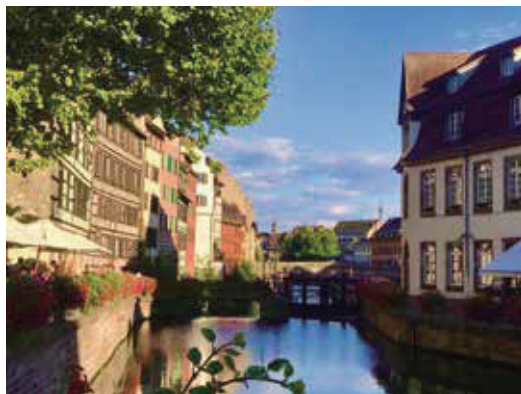
藍天白雲綠樹，色彩全都配合的恰到好處的運河都市。