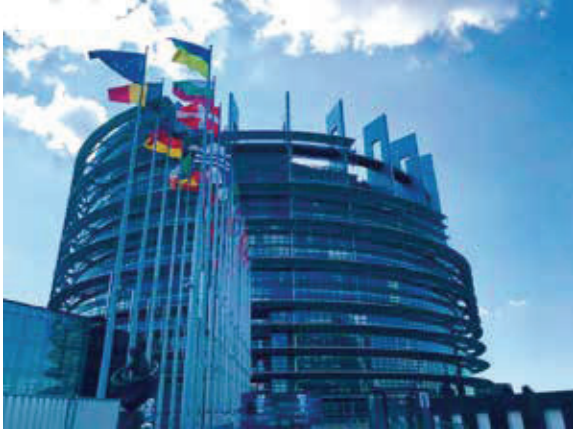
歐盟總部所在地—比利時首都布魯塞爾。