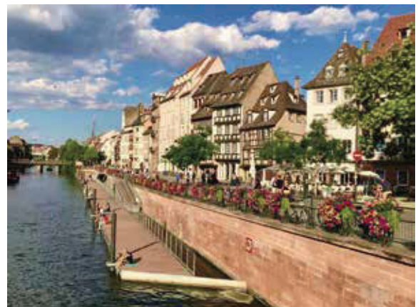
中央運河是比利時瓦隆大運河的一條運河，全長20.9公里。