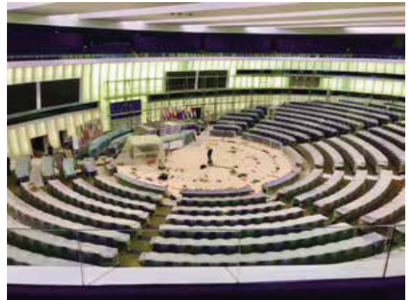
歐洲議會民主中心，不能錯過的半圓形議場。