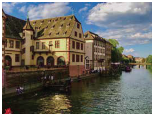
童話般的運河城市。